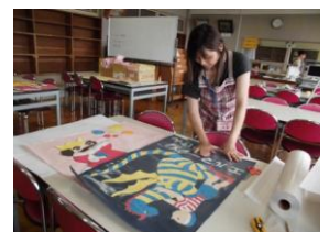
掲示物も引っ越しです。

図書館・保健室・かけはしルームの引っ越しにも、ボランティアの方々のお力をお借りしました。ありがとうございます！